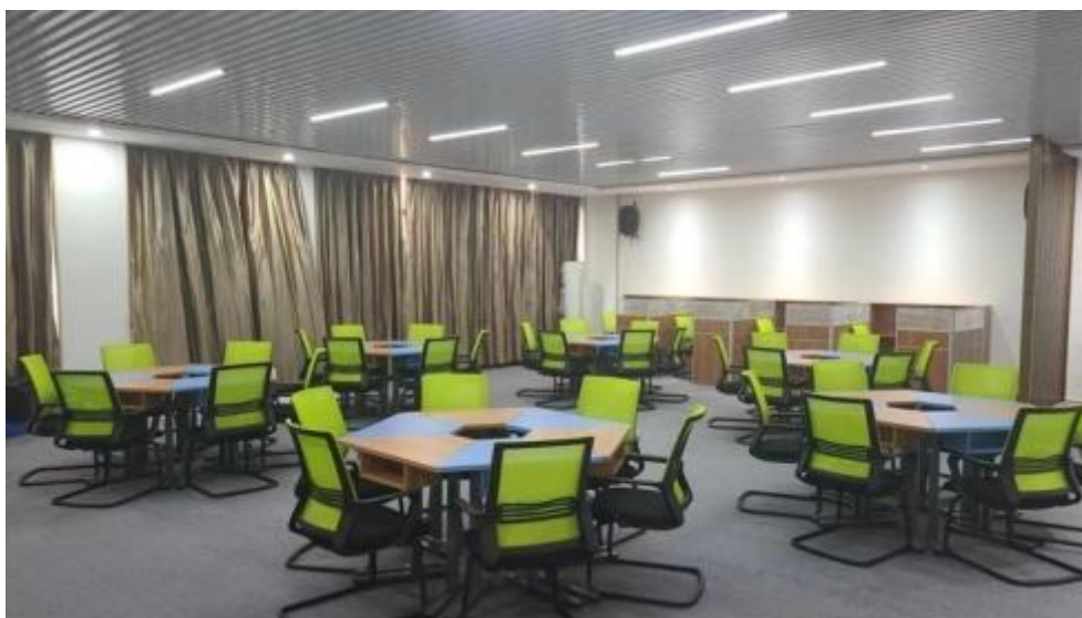
图 智慧零售运营中心