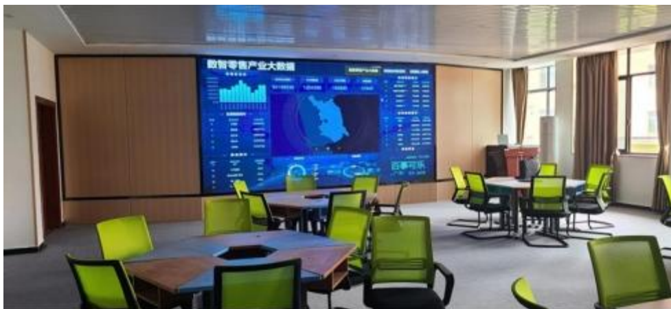
图 智慧零售运营中心