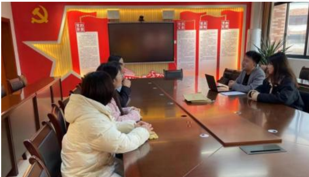
图 校企开展学术研讨项目交流会议

公 高度 队 的 ，充分 到 和 的关 ，对 高 和 关 的 。此公 供 ，包 更 、 方法 及 导 发 程，并 持 丰富 的 家 过 、 会 和 际案 ， 队 分 的 和 。 常 地 活动， 包 参加 会 、 等 ， 促 调 的 分 ， ， 并 的 队 ( )。