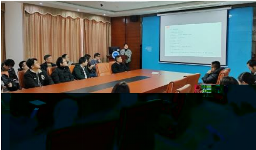
图 员工专业技能培训

，公 促 发 和 才 方 得 成 。 过 创 的 和 ， 不 动 公 的 持 成长， 工 供 的发 机会。 过 供多 化的 和发 ， “ 队 共 ” 等 活动 ( )， 帮 工 ( 技 和管 ； 并 的 和 规划， 工的 合 和 ， 包 导 发 计划、技 技 及 部 等， 地促 工的 方 发 。